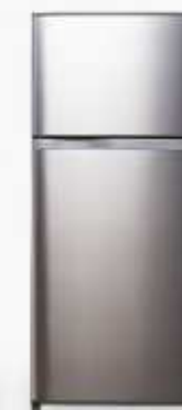
GR-W67KD (BS) 19.9 Q GR-W72KD (BS) 19.9 Q GR-W73KDA (BS) 19.9 Q