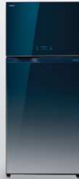
600L Godation (GG)