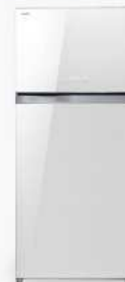
GR-W67KDA (ZW) 19.9 Q GR-W73KDA (ZW) 21.8 Q