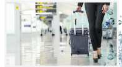
(For The Glass Collector)

ประหยัดค่าไฟฟ้าด้วยโหมด ECO ในช่วงเวลาที่คุณไม่อยู่บ้านหรือในวันที่คุณใช้งานน้อย ECO Mode จะช่วยลดการใช้พลังงานไฟฟ้าลง