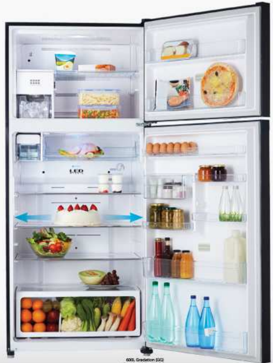
600L Gradation (GG) Auto-Ice Maker Model