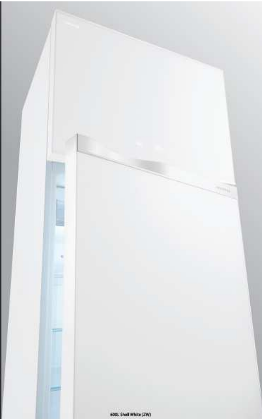
600L Shell White (ZW)