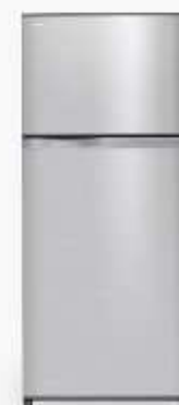
GR-W67KD (S) 19.9 Q GR-W72KD (S) 21.8 Q GR-W73KD (S) 21.8 Q