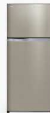
GR-W67KD (C) 19.9 Q GR-W72KD (C) 21.8 Q GR-W73KD (C) 21.8 Q