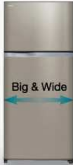
600L Light Gold (G)