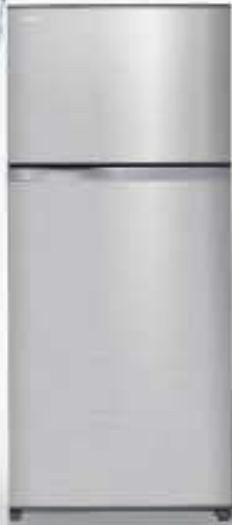
600L Silver (S)

ชั้นวางใหญ่ขึ้น รองรับภาชนะขนาดใหญ่สำหรับงานปาร์ตี้ของคุณ