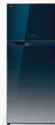
GR-W67KDA (GG) 19.9 Q GR-W73KDA (GG) 21.8 Q