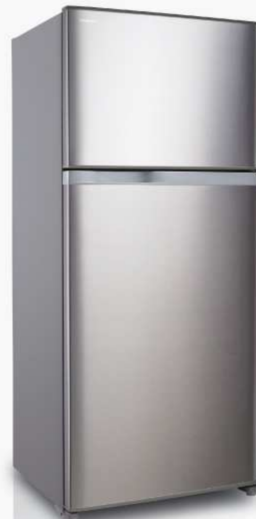
800L Bright Stainless (BS)

ด้วยคุณสมบัติของสารเงิน (Ag+) ทำให้ผัก ผลไม้ คงความสดได้นานขึ้น